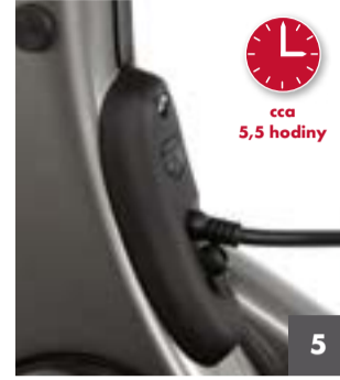
5 Nabíjení je dokončeno, když se kontrolka nabíječky rozsvítí zeleně a všech deset LED segmentů na panelu bliká (viz krok 2: C).