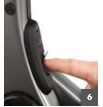
6 Až bude baterie plně nabitá, odpojte nabíjecí kabel a vraťte zpět gumový kryt nabíjecího konektoru.