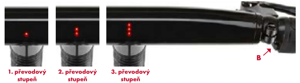
1. převodový stupeň

POZOR! Elektronické řazení může být v porovnání s tradičním mechanickým řazením vnímáno jako citlivé. Než vyjedete na cesty nebo silnice s hustým provozem, seznámete se prakticky s řazením nahoru a dolů.