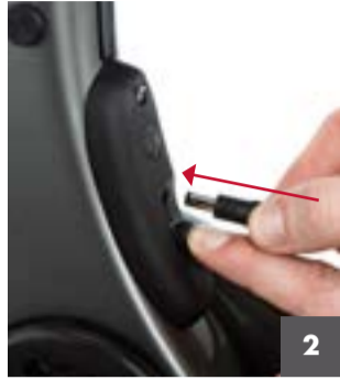
2 Přidržte gumový kryt nabíjecího konektoru otevřený a zapojte nabíjecí kabel.