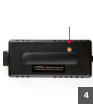
4 Kontrolka nabíječky se rozsvítí oranžově a signalizuje nabíjení.