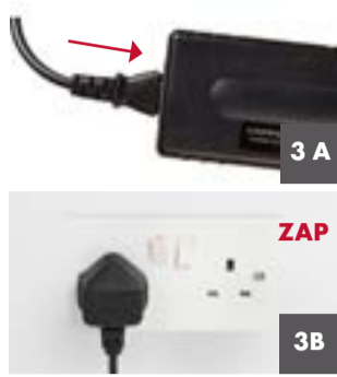
3 A) Zapojte síťový kabel do nabíječky. B) Zapojte nabíječku do sítě a zapněte (má-li zvláštní vypínač).